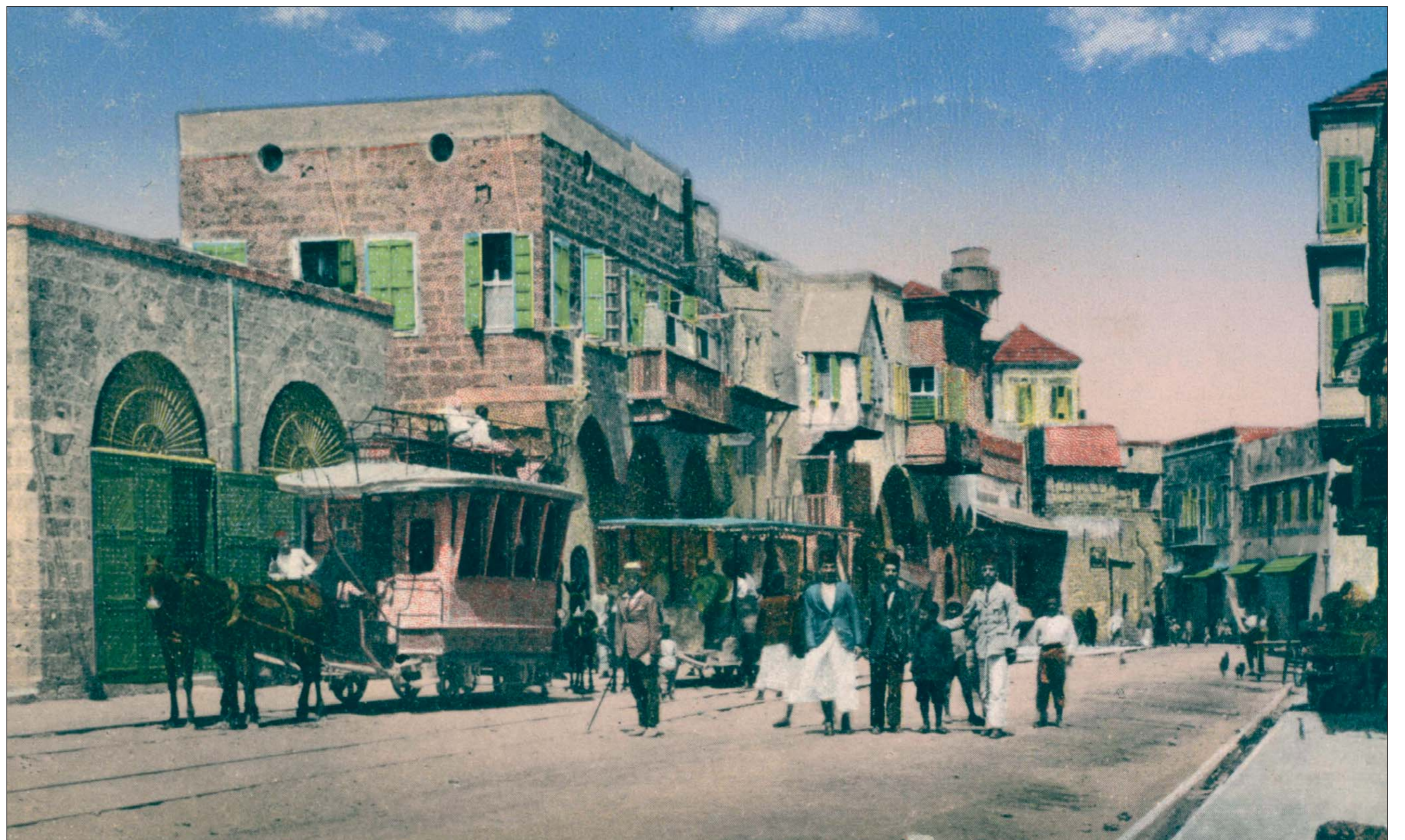
Die Pferdetram als öffentliches Verkehrsmittel in Tripoli

Im Rahmen dieses Forschungsschwerpunktes sollen die Akteure in ihrem Arbeitsleben (Produktion, Handel, Dienstleistung) analysiert werden. Ausgangspunkt der Untersuchung bilden die drei räumlichen Schwerpunkte städtischer Wirtschaft: der Bazar in der Altstadt von Tripoli, die Gebiete nördlich und nordwestlich der