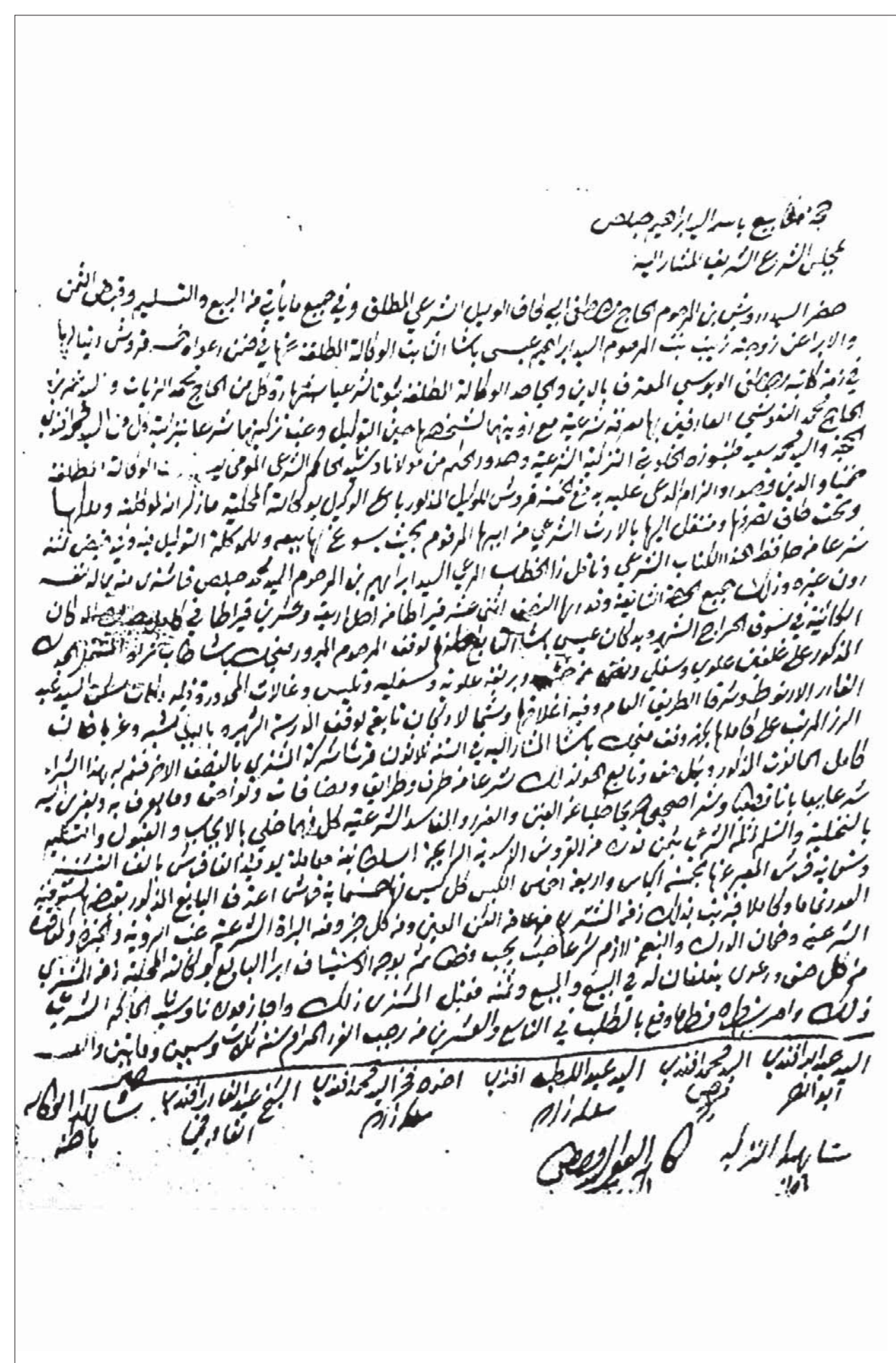
Gerichtsakte aus Band 36 bezüglich Suq Haraj

Die Stadtverwaltung von Tripoli unterstützt das Projekt und stellt für die Arbeiten vor Ort ein Arbeitsraum zur Verfügung.