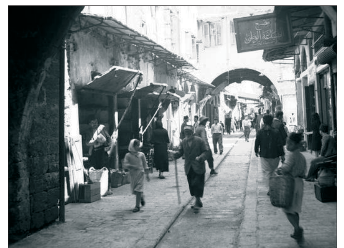
Straßenszene im Suq von Tripoli um 1900