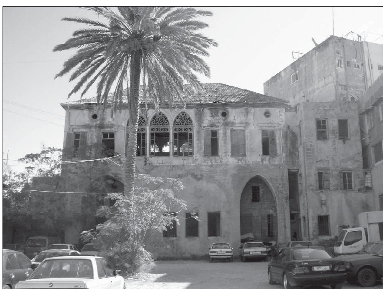
Bait Mughrabi in Tripoli al-Nouri