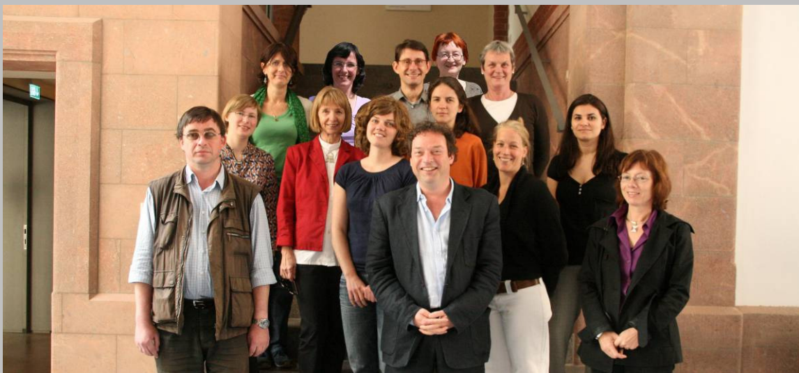
Die Mitarbeiter des Museums für Islamische Kunst 2009