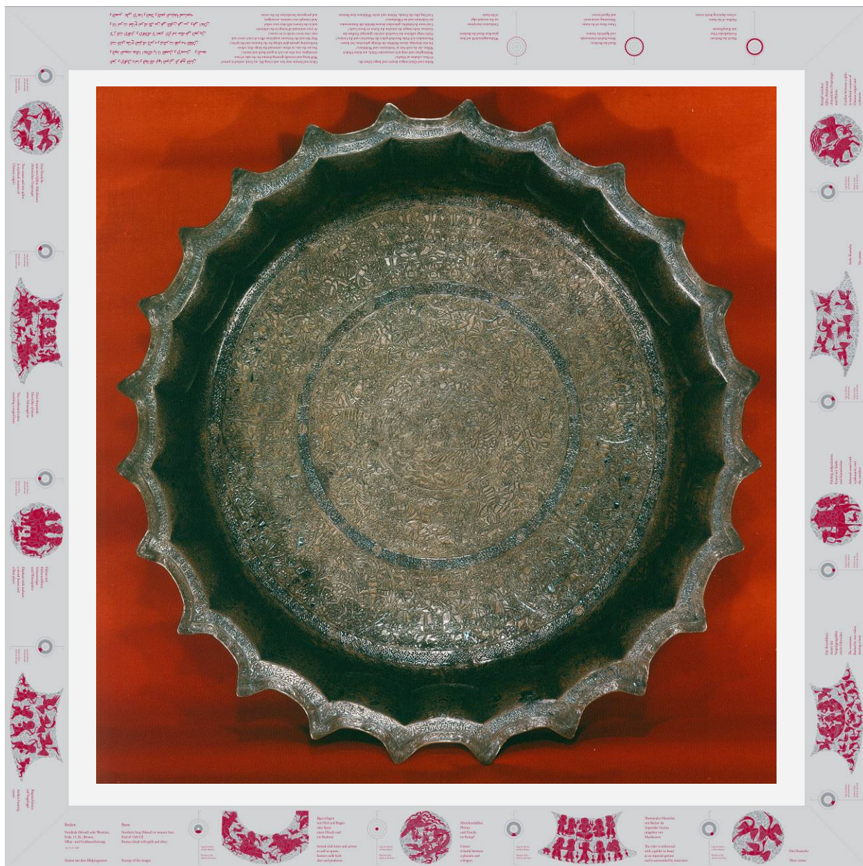
Entwurf der Lesehilfe um das Mosulbecken (Inv.-Nr. I. C. 1061).

wir kaum nachkommen können. Auch die Entwicklung neuer Ausstellungen ist mit der jetzigen Haushaltssperre ein immer schwieriger werdender Auftrag. Ein Beispiel: