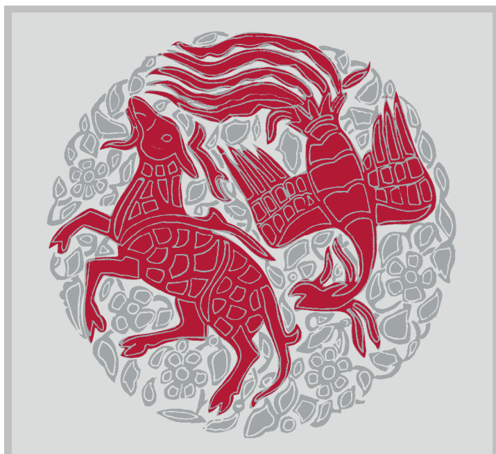
Phönix jagt Qilin – Umzeichnung eines Medaillon des Mosulbeckens: Es bleibt spannend im Museum für Islamische Kunst.

Es sind schon solche kleinen Dinge, an denen es manchmal scheitert, und Hilfe durch einen Freundeskreis ist dringend von Nöten. Das Museum hat trotz der fehlenden Strukturen große Möglichkeiten. Es ist eigentlich nicht schwer, neue Ansätze oder auch lange im Raum schwebende Ideen umzusetzen. Das haben unsere Ramadannächte gezeigt. Es ist jedoch oft zu viel (oder monetär zu wenig) für ein kleines, schon über seinen Möglichkeiten arbeitendes Team. Wir brauchen also Ihr Engagement – entweder finanziell oder aber auch durch Ihre Mitarbeit im Freundeskreis. Es lohnt sich in jeder Hinsicht: Unser Mitgliedsausweis gilt als Jahreskarte der Staatlichen Museen und gewährt – Sesam öffne dich – freien Zutritt zu den Dauerausstellungen der 16 Staatlichen Museen in Berlin. Mehr erfahren Sie auf unserer Webseite: www.fmik.de oder schreiben Sie uns. Noch warten wir auf Antwort des Amtsgerichts, doch werden wir noch im Januar tätig werden können.