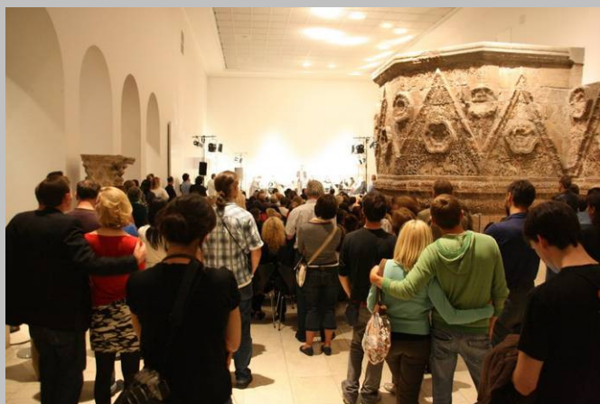
Nächte des Ramadan: das Konservatorium für Türkische Musik Berlin im Mschatta-Saal am 10. September 2009.

Ein besonderer Höhepunkt 2009 waren die Nächte des Ramadan, die wir mit den Besucherdiensten, der Piranha Kultur und der Kulturbrauerei veranstaltet haben. Sie waren als erste ihrer Art an einem