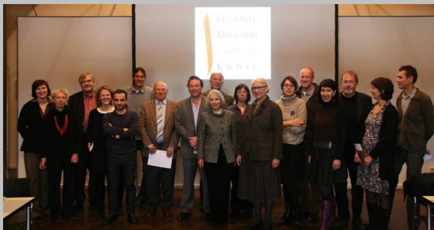
Gründungsversammlung der Freunde des Museums für Islamische Kunst im Pergamonmuseum e.V. am 23. Oktober 2009.

Unser Museum ist nun 105 Jahre alt, hat ein ehrwürdiges Alter erreicht und sollte seine Aufgaben hier in Deutschland übernehmen. Neben unseren primären Feldern der Erforschung und Ausstellung von Kunst und Architektur, oder im weitesten Sinne materieller Kultur, der Bewahrung und Pflege der Artefakte als kultureller Speicher muslimischer Gesellschaften in