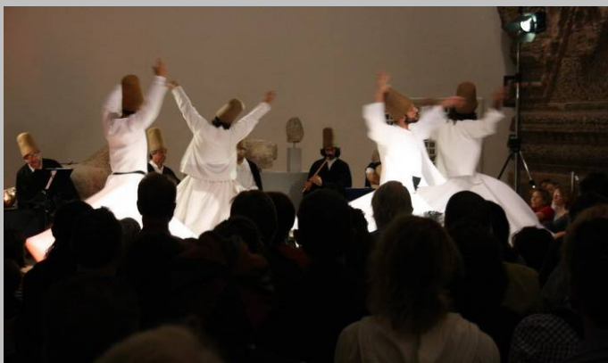
Nächte des Ramadan: Galata Mevlevi Ensemble - die wirbelnden Derwische aus Istanbul im Mschatta-Saal am 5. September 2009.

Der große Personalwechsel fand im ersten Halbjahr 2009 statt, doch gibt es auch für das zweite Halbjahr Neues zu berichten. Verstärkt wurden wir durch den Exzellenzcluster Topoi ( www.topoi.org ). Seit Mai sind wir Mitglied der Cross-Sectional-Group IV („Museen“) der