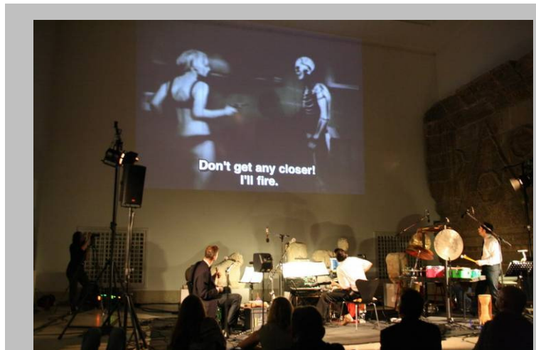
Nächte des Ramadan: Live-Vertonung zu dem türkischen Kultfilm »Kilink Istanbul'da« (1967) von Alexander Hacke, Khan of Finland & N.U. Unruh am 13. September 2009.

Museum in Berlin, vielleicht sogar in Deutschland, ein toller Erfolg: In den Räumlichkeiten des Museums für Islamische Kunst, der Museumsinsel, dem Lustgarten und auf den Treppen des Alten Museums verfolgten fast 9.000 Besucher zwei Wochen lang die vielfältigen Präsentationen internationaler Künstler aus mehr als 15 Ländern. Interessierte aller Konfessionen und Couleur staunten, lauschten und genossen bei Musik,